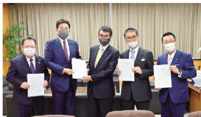
左から、「酒井庸行参議院議員」「県連会長 藤川政人参議院議員」「河野太郎 閣僚大臣」「伊藤忠彦衆議院議員」「丹羽秀樹衆議院議員」