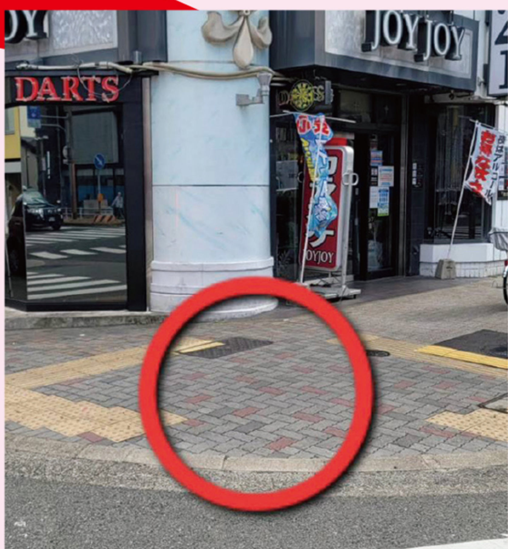
ガードポール設置要望