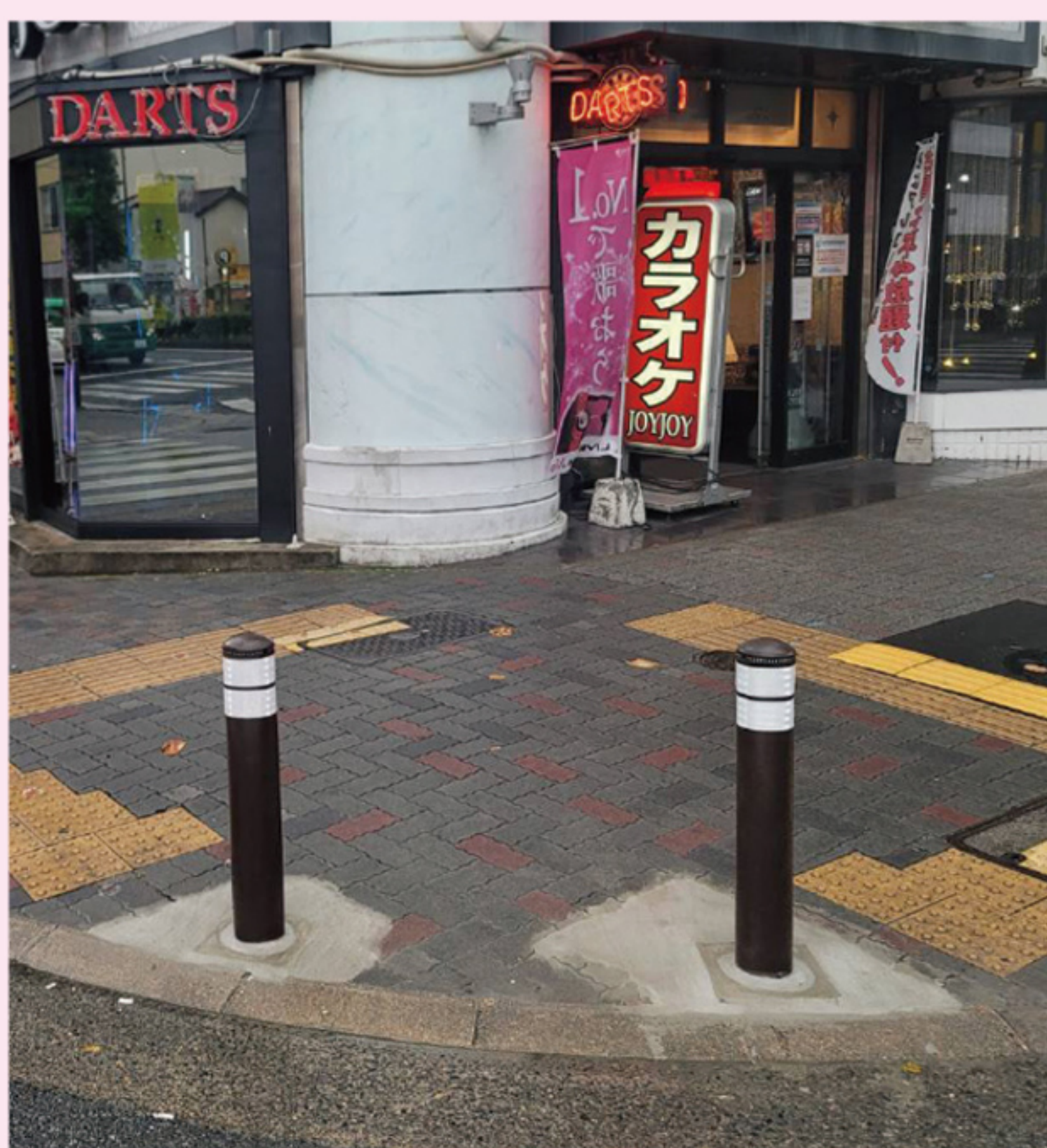
ガードポール設置

2年間で、2回も車が突っ込んでいる赤門交差点に、ガードポールを設置させて頂きました。大須商店街が近いこと、たくさんの人が行き交う場所であることから、交差点に滞留する人が事故に巻き込まれることが懸念されていました。