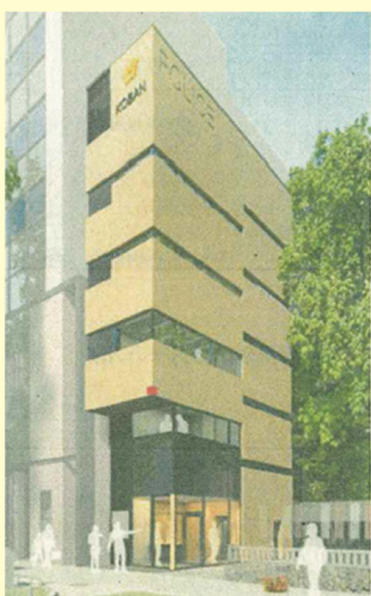
栄幹部交番完成予想図

2年間で、2回も車が突っ込んでいる赤門交差点に、ガードポールを設置させて頂きました。大須商店街が近いこと、たくさんの人が行き交う場所であることから、交差点に滞留する人が事故に巻き込まれることが懸念されていました。